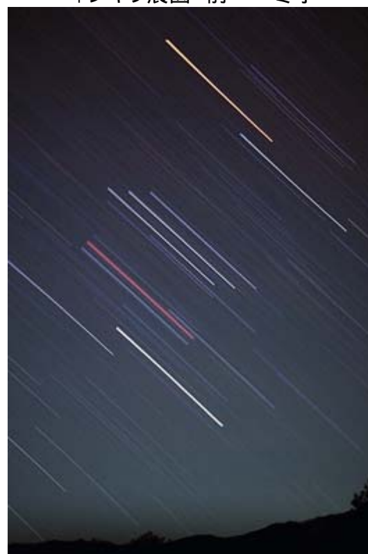
もみじ平 冬季【オリオン座】