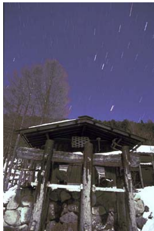
トンキラ農園 前 冬季