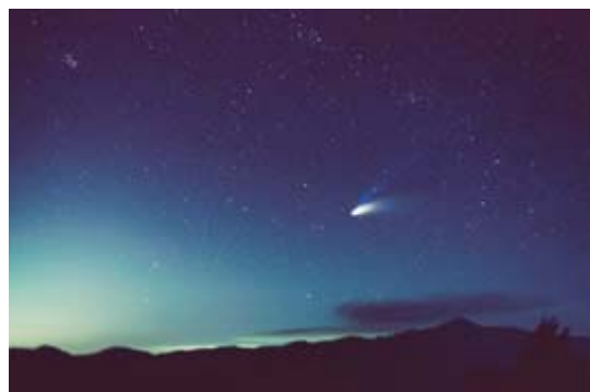
蛇峠 馬の背【彗星】 彗星なので今は見えません。