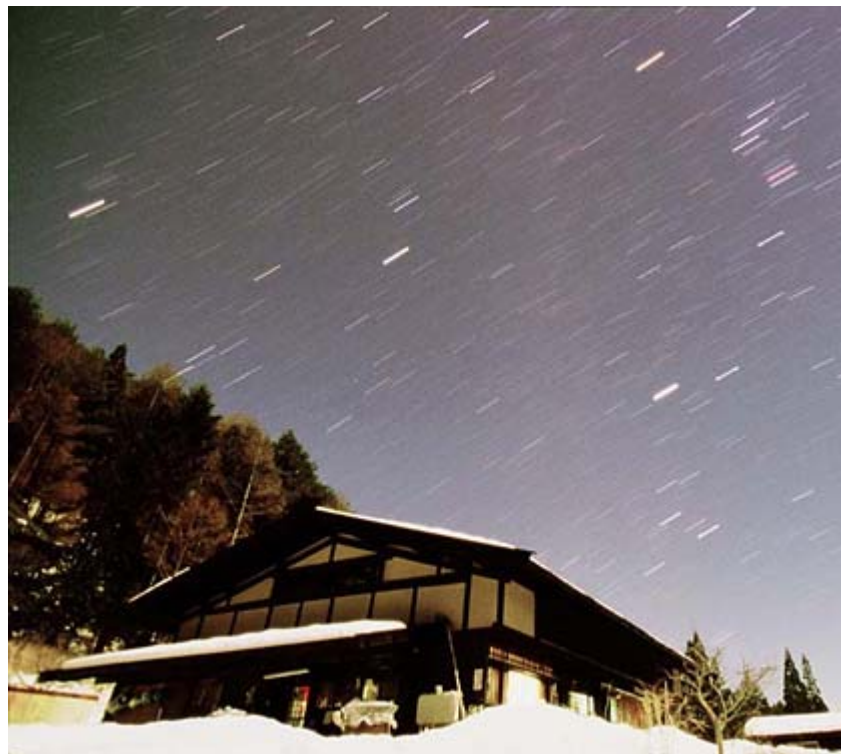
トンキラ農園さんの前 冬季 [オリオン座]の方向