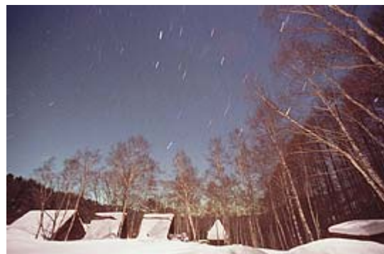
もみじ平キャンプ場 冬季 [ぎょしゃ座]の方向