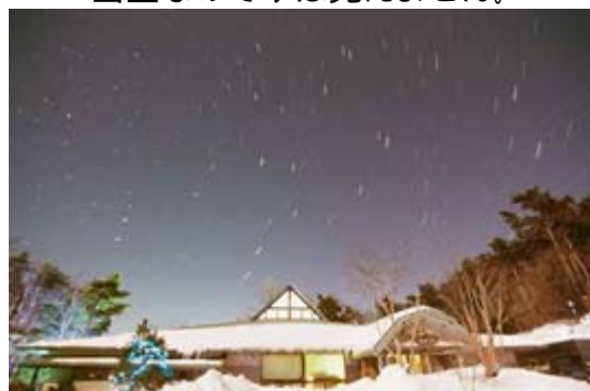
宿り木さん前 冬季 【北の夜空】