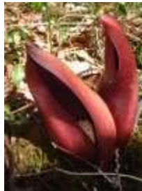
治部坂高原の座禅草が、開き始めました。